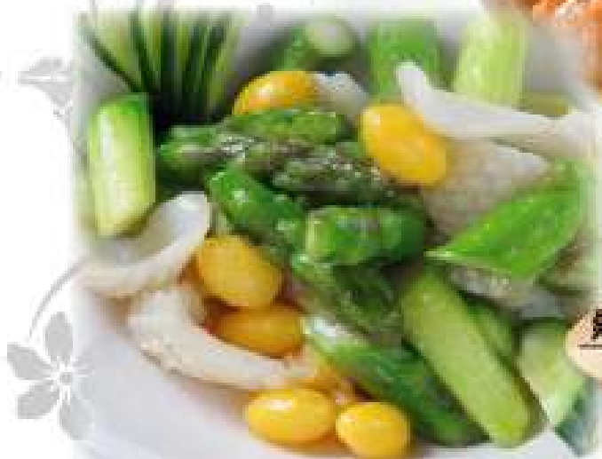
銀杏芦笋炒魷魚 1600円